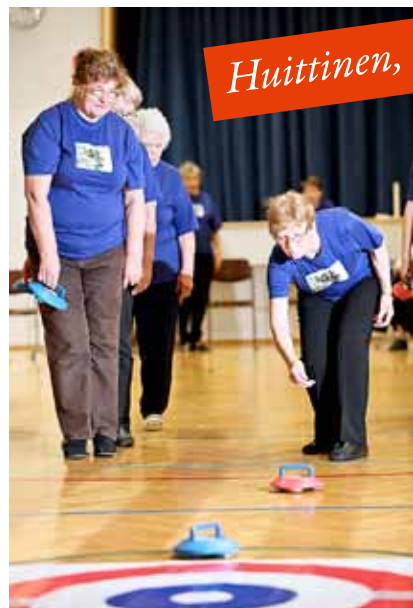
Sisäcurlingista tuli uuden liikuntavälinelainaamon suosikkituote.