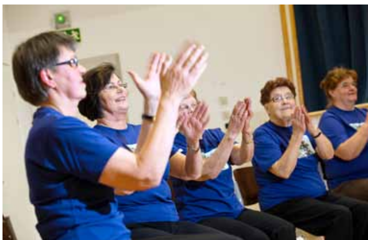
Istumantanssi vetää viikoittain yhteen kahden yhdistyksen jäseniä.

– Henkilökohtaisesti suurin oivalus on ollut se, kuinka valtava voimavara yhdistyskenttä oikein on. Nykyään on mukava järjestää kaikenlaisia liikuntatempauksia, kun tietää yhdistysväen lähtevän varmasti mukaan.