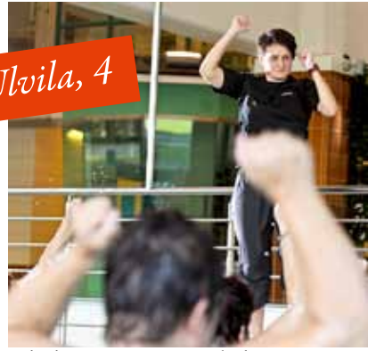
Uvilan esteetön Kaskelotti ja uimaryhmät ovat kaikille avoinna.