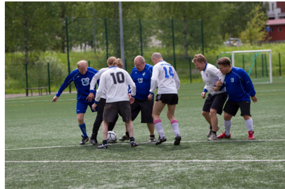
KKI-ohjelma/Studio Juha Sorri

Suomen Reumaliiton ja Rochen yhteistyöhankeen Hyvän hoidon puolesta ME-kävely -teemasivusto: www.mekavely.fi